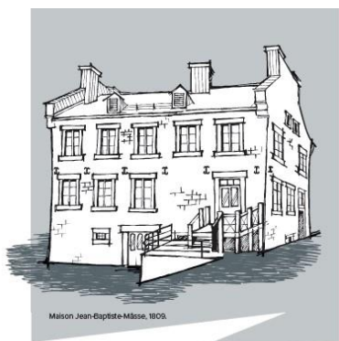
Maison Jean-Baptiste-Mâsse, 1809.